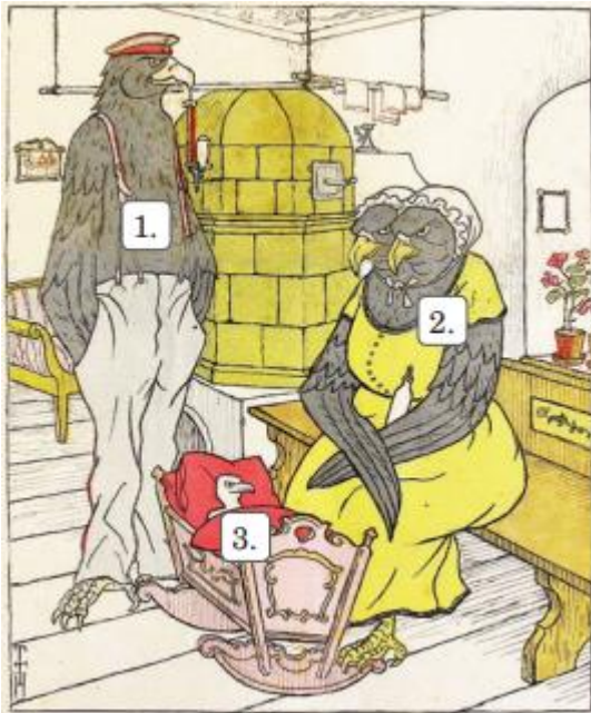
Karykatura zatytułowana Polski orzeł pochodzi z wydania niemieckiego tygodnika, które ukazało się w 1916 r. po ogłoszeniu Aktu 5 listopada . Do rysunku dołączono podpis: Oby tylko nie zapomniał, że to myśmy go wysiedzieli!

A. Wyjaśnij co oznaczają orły oznaczone liczbami 1-2