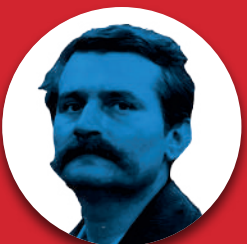
LECH WAŁĘSA (1943)

Astronom, autor dzieła O obrotach sfer niebieskich. Dokonał przełomu naukowego – przedstawił szczegółowo teorię heliocentryczną, w której udowodnił, że Ziemia kręci się wokół Słońca. Jego tezy wywołały rewolucję naukową nazywaną przewrotem kopernikańskim.