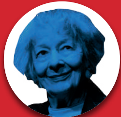
WISŁAWA SZYMBORSKA (1923-2012)