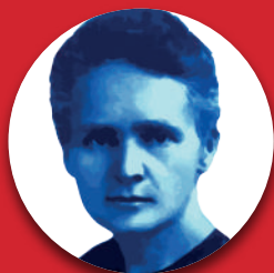
MARIA SKŁODOWSKA-CURIE (1867-1934)