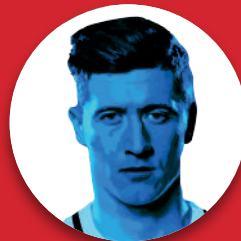
ROBERT LEWANDOWSKI (1988)