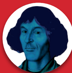
MIKOŁAJ KOPERNIK (1473-1543)

Polska chemiczka i fizyczka. Rozwinęła teorię promieniotwórczości, odkryła dwa nowe pierwiastki – rad i polon. Z jej inicjatywy rozpoczęto także badania nad leczeniem raka za pomocą promieniotwórczości. Większą część życia razem ze swoim mężem, Pierrem Curie, spędziła we Francji.