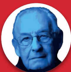
ANDRZEJ WAJDA (1926-2016)

Supermoc: Polski i amerykański bohater wojenny