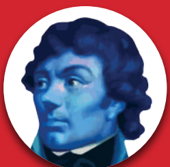
TADEUSZ KOŚCIUSZKO (1746-1817)