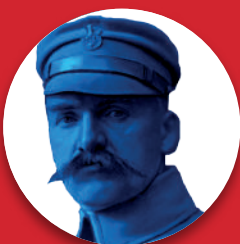
JÓZEF PIŁSUDSKI (1867-1935)

Z zawodu elektryk, współzałożyciel ruchu związkowego „Solidarność”. Był jedną z kluczowych postaci obrad „Okrągłego Stołu” w 1989 r., które doprowadziły do wyłonienia nowego rządu. Był pierwszym prezydentem Rzeczypospolitej Polskiej wybranym w wolnych wyborach. Otrzymał Pokojową Nagrodę Nobla.